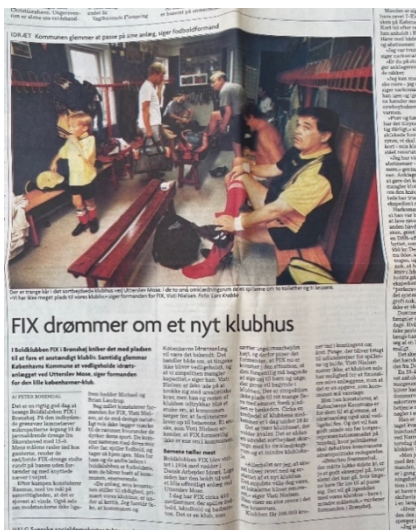
Jyllands-Posten København 22. september 1998.

Vi er oprindeligt en klub med flere discipliner. Da jeg startede mit bestyrelsesarbejde i klubben, havde vi både håndbold, badminton og