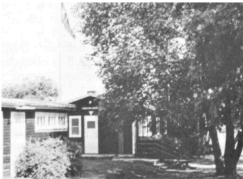
Det nye klubhus blev bygget i 1954.