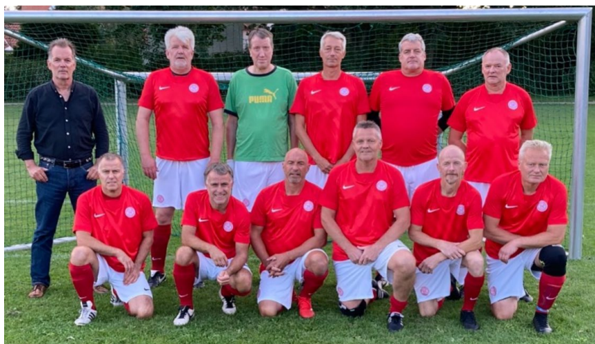
7-mands 55+, 2021