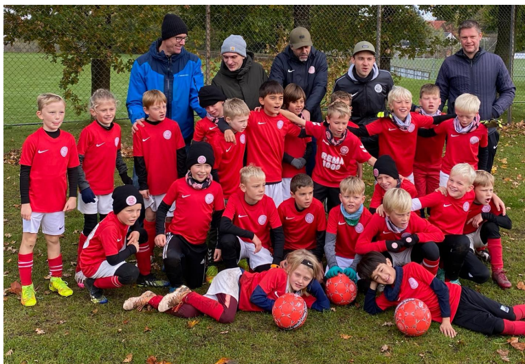
U/9 drenge til Øens Cup 2021