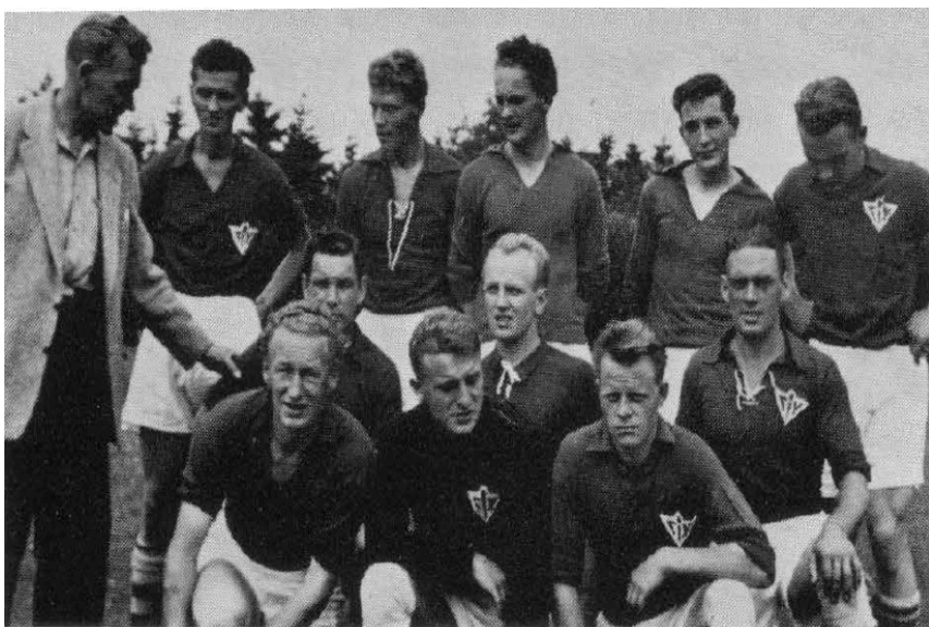
Klubbens førstehold i 1958.

som lå samme sted, som vores nuværende klubhus ligger. Selv med det nye klubhus var alt ikke udelukkende fryd og gammen. I 1958 var klubbens medlemstal nede på 84, og klubben havde økonomiske udfordringer. Det kom så vidt, at DAI truede med at lukke klubben ned pga. klubbens gæld. Det kom dog heldigvis aldrig så vidt.