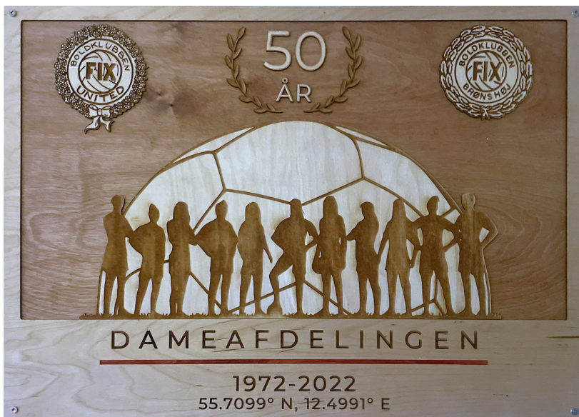
Dameafdelingens 50-års jubilæumsdekoration.