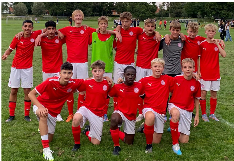
U/15 Brønshøj Fix, 2023