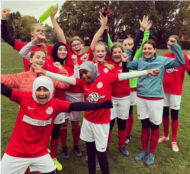
U/14 piger, 2020