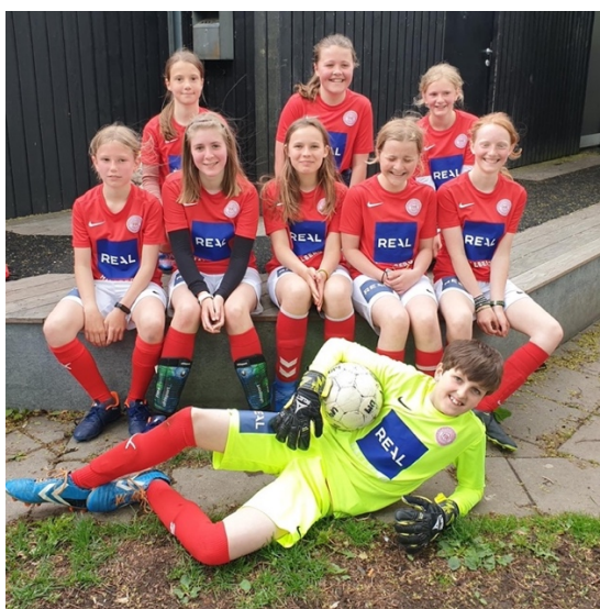
U/12 piger, 2022