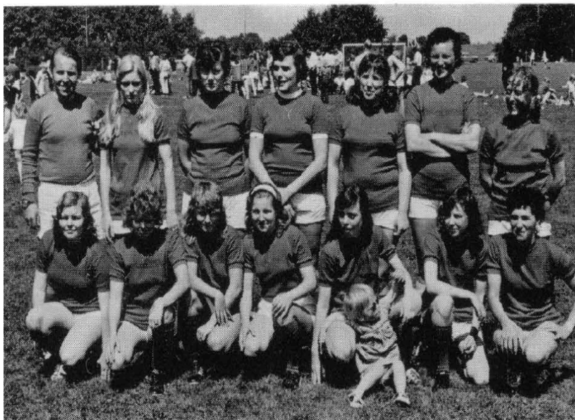
Damesenior i 1972.