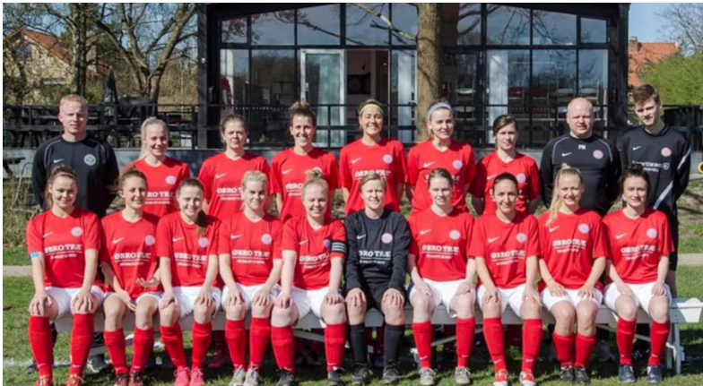
Damesenior midt 2010'erne