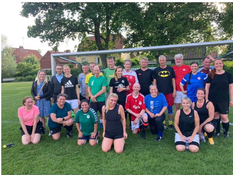
Fix Mix i 2024.

familiemedlemmer sågar fra forskellige generationer. Kort sagt er alle velkomne i Fix Mix, hvilket taler direkte ind i Fix-ånden. Naturligvis er fodbolden vigtig for Fix Mix, og man træner for at lege og holde sig i form, men det sociale er lige så vigtigt. Det er ikke unormalt, at træningen tager én time, men hvis man tæller omklædningen, bad og et besøg på det lokale værtshus med, så er afdelingens medlemmer hjemme fem timer efter træningen startede.