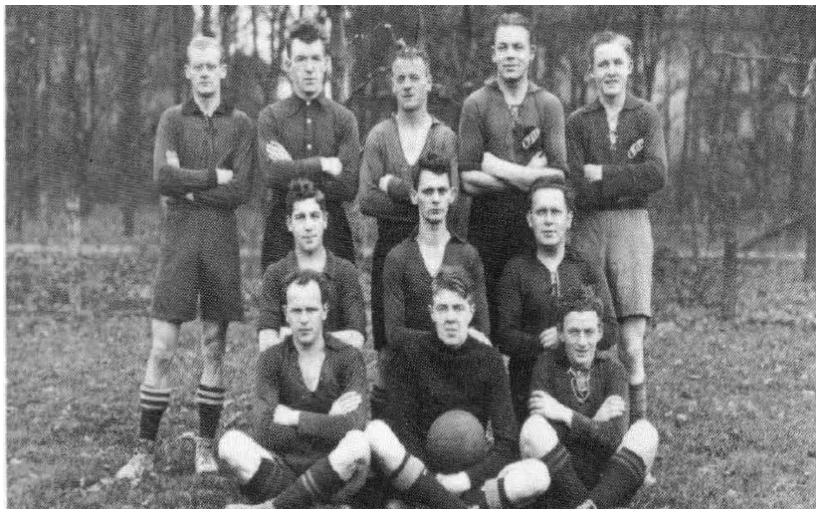
Klubbens førstehold i starten af 1930'erne.