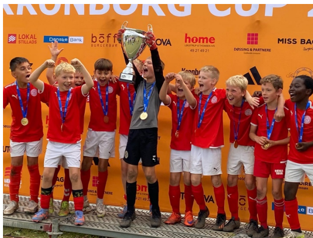
2013-drenge som vinderne af Kronborg Cup 2023