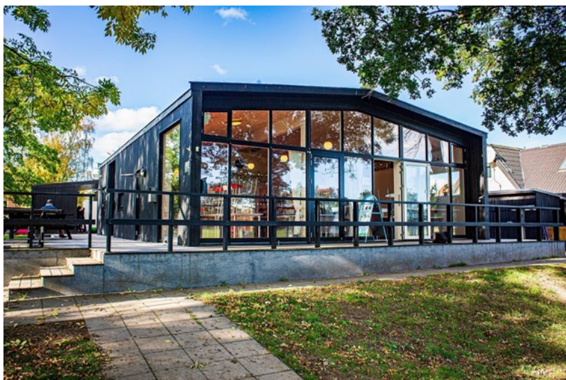
Klubbens nuværende klubhus, som blev indviet i 2014.

Selvom Fix er en gammel klub, bliver den ved med at udvikle sig. I 2017 til en vinterfest blev Fix Mix stiftet, og fungerer i dag i bedste velgående. Der havde i et stykke tid været udfordringer på de forskellige voksenhold (ældre end senior), mht. at være nok til træning. Det blev aftalt, at man fra 2018 slog flere hold sammen fra oldboys og -girls og opefter. Så hvor der før havde været en håndfuld spillere til en træningsaften, kunne der nu uden problemer møde over 20 medlemmer til træning. Fix Mix består af spillere fra sidst i tyverne til over halvfjerds år. Det er helt nye medlemmer af klubben til nogle, som har været medlemmer i over halvtreds år. Det er gamle skolekammerater, ægtepar og kærestepar. Det er nogle, som har spillet ungdomsbold sammen eller nogle, der startede i en sen alder. Det er