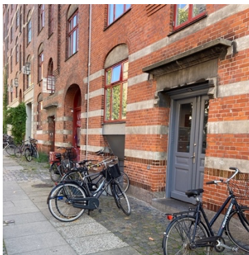
Klubben blev stiftet i porten til gennemgangen Vølundsgade 26.

I klubbens første levetid søgte man kampe mod andre klubber, som i forvejen var i besiddelse af en bane, da Fix ikke selv ejede sådan en. Den første kamp Fix spillede, var mod Heimdal, der spillede sine kampe på en fælled på Finsensvej. Kampene indgik ikke i en egentlig turnering, og kan betragtes som gade- eller privatkampe. De første kampe blev vundet ret stort, og klubben prøvede at få et samarbejde op at stå med nogle andre gadeklubber fra Nørrebro.