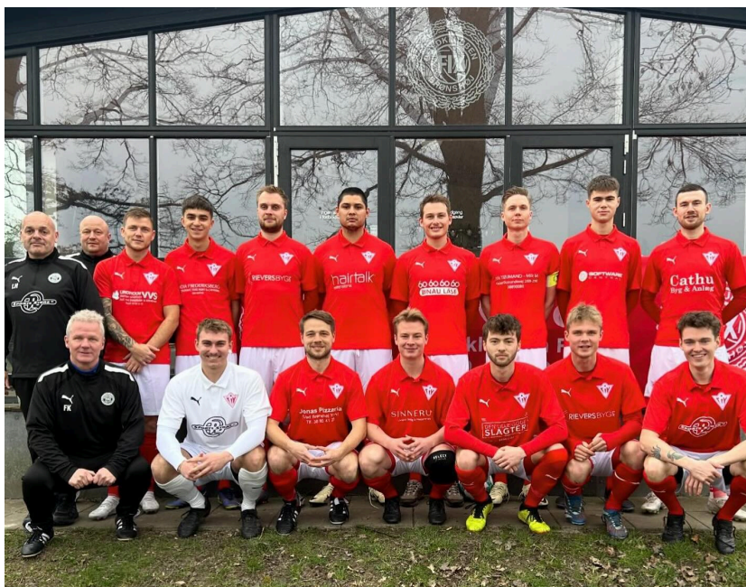
1. herresenior 2024

Den sidste del af jubilæumsskriftet er en lille samling af billeder fra det nye årtusind.