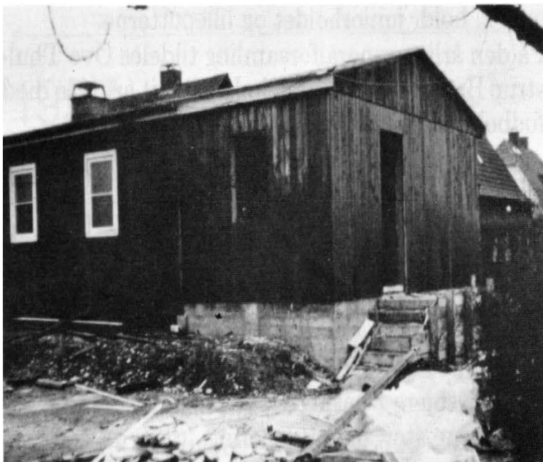
Klubhuset udvides i 1966.

kom 88 nye medlemmer, hvoraf de fleste var ungdomsmedlemmer. Dette fortæller os dog, at der var god stemning omkring klubben, da de unge mennesker ønskede at fortsætte med at spille bold og være en del af fællesskabet. I midten af 60'erne har klubben fire herresenior hold. Klubbens eget blad blev navngivet i samme periode, da den havde kørt uden navn i flere år. Bladet blev navngivet Tredje halvleg, da der var konsensus i klubben om, at man altid klarede sig god i denne halvleg. Ydermere fik klubhuset en udvidelse i 1966, da dommerne nu også fik deres eget omklædningsrum.