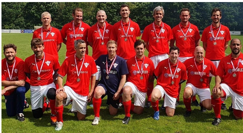
+40 veteranerne til landspokalfinale i Silkeborg, 2024