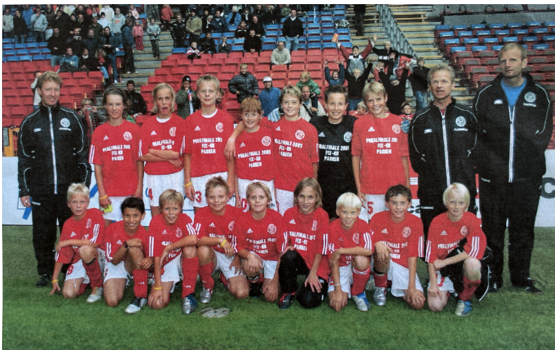
Lilleputterne i Parken i 2005.