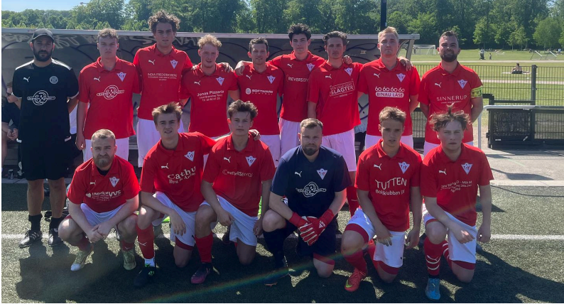
2. herresenior 2024