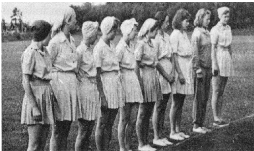
Håndbolddamerne på tur i Oslo i 1949.